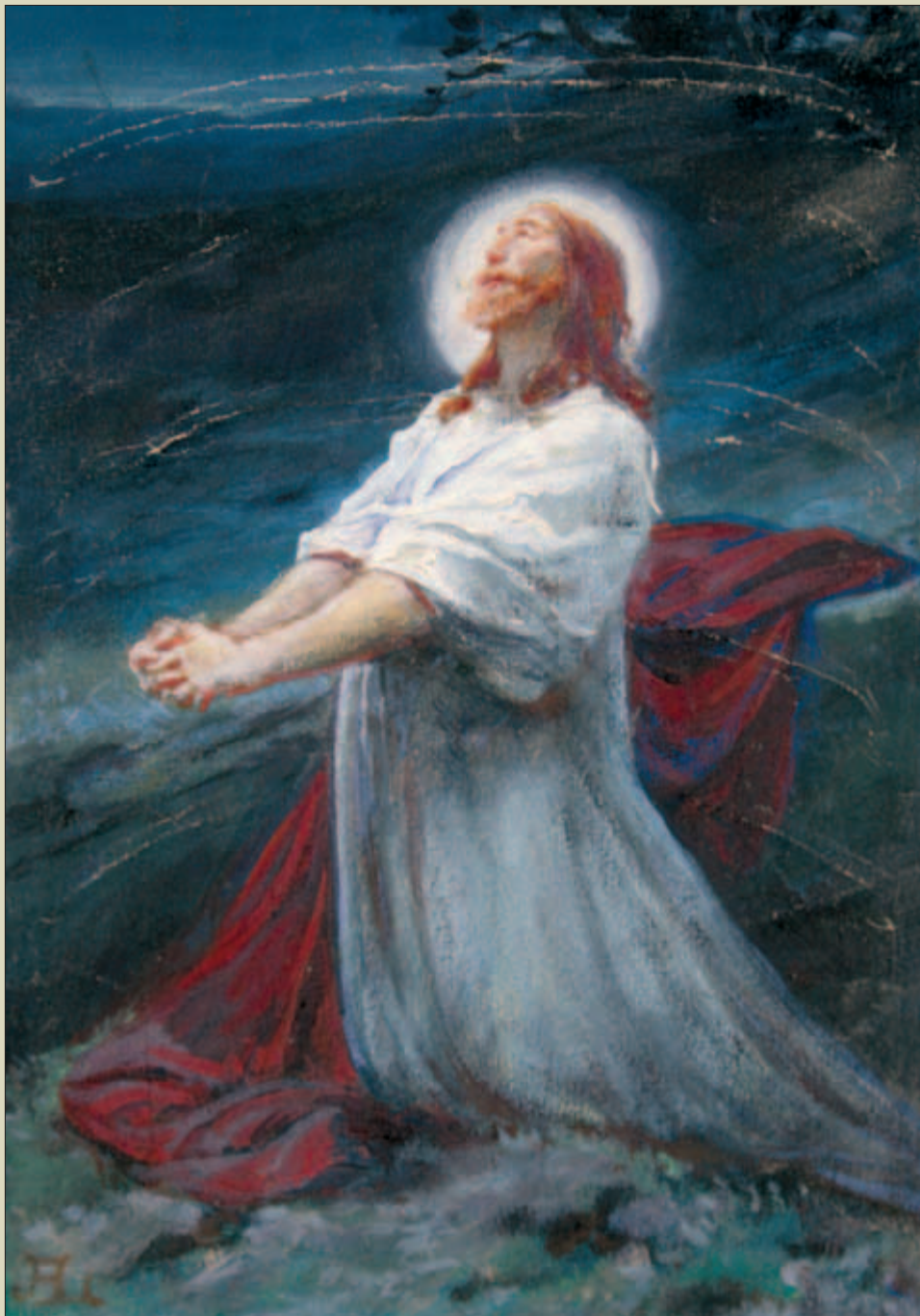
Adolf Liebscher – V Getsemanské zahradě, olej